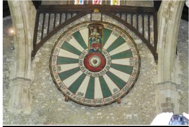
table liée à la légende du Roi Arthur