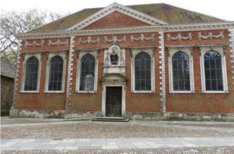
Bâtiment abritant la salle de cours