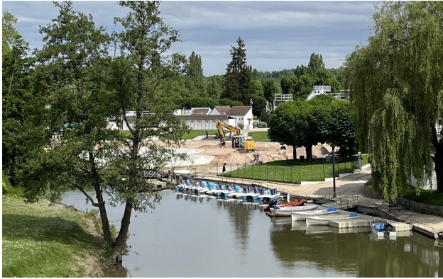
La Plage de l'Isle-Adam