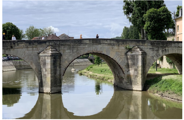
Le pont du Cabouillet

Puis repas dans un restaurant au bord de l'Oise.