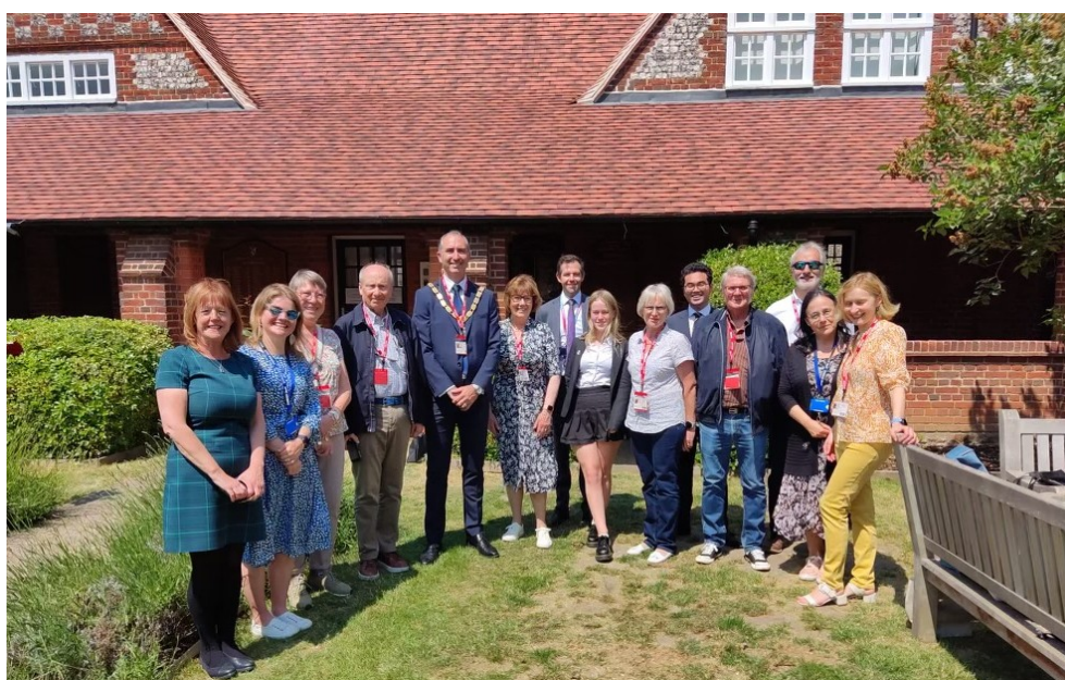
Sir William Borlase's Grammar School Pendant notre séjour une vingtaine de collégiens de Marly y effectua un stage.