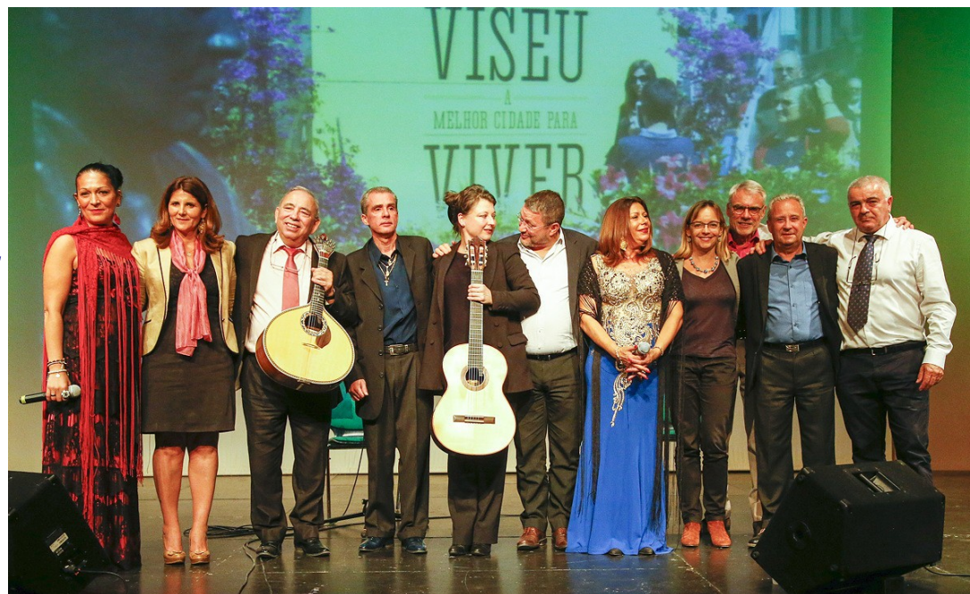
La soirée Fado, le 29 septembre 2018 à la Salle des Fêtes