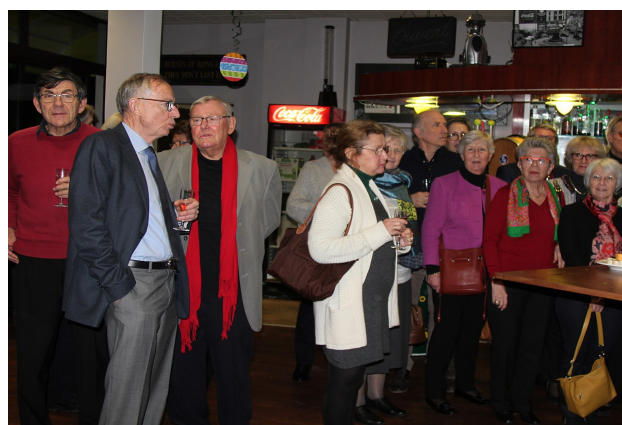
Le dîner annuel des Amis du Jumelage le 25 janvier 2019 à Maisons-Laffitte