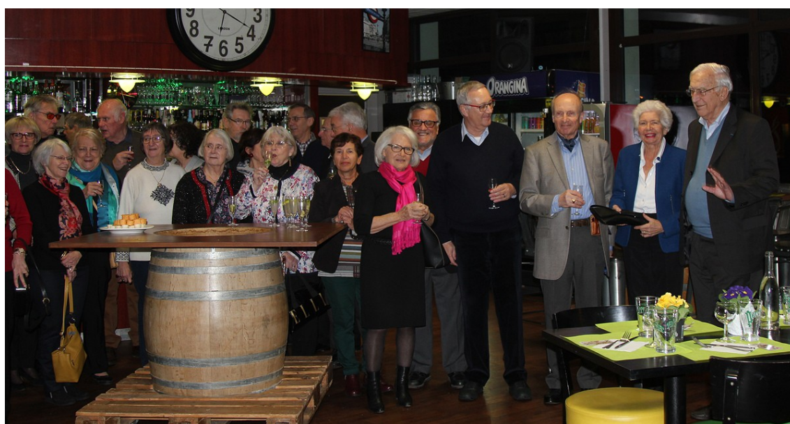
Une ambiance très conviviale ; en route pour une nouvelle année de jumelage !