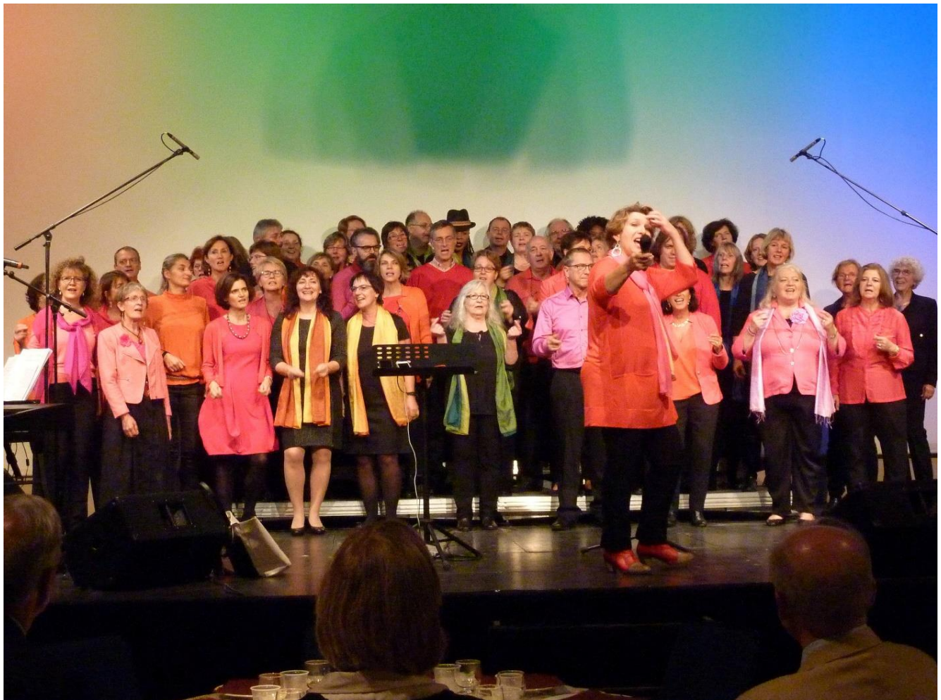
Gospelchor „Seeds of Joy“ aus Marly und Chor Color aus Leichlingen